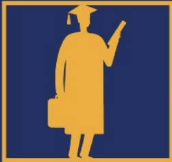
Hope Parent Scholar

Requisitos: Los programas postsecundarios basados en la matrícula para los Hope Parent Scholars requieren la inscripción a tiempo completo del Hope Scholar y un progreso académico satisfactorio.